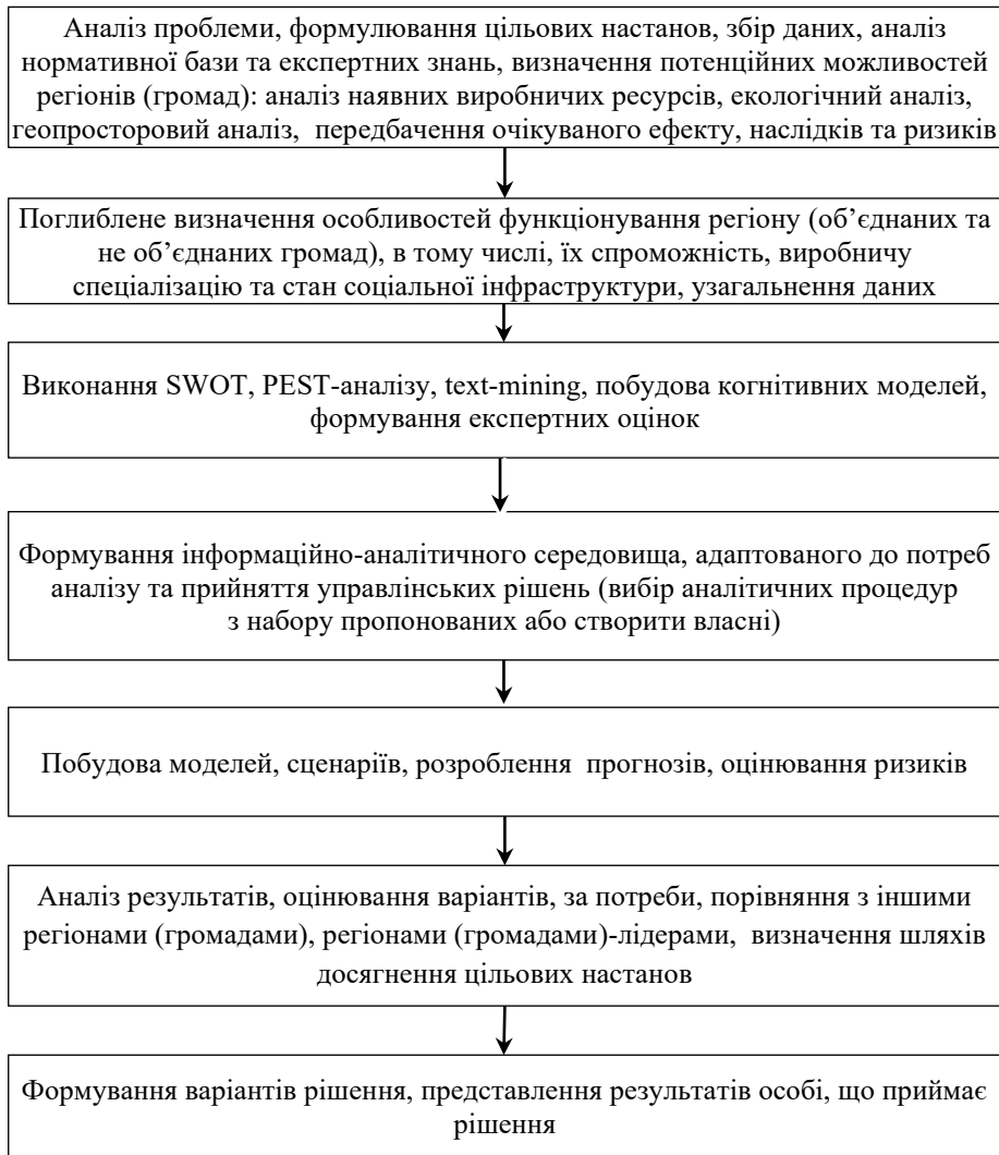
Рисунок 4. Загальна (спрощена) схема застосування інформаційних технологій для підтримки прийняття рішень в управлінні регіональним розвитком

Загальна (спрощена) схема застосування інформаційних технологій для підтримки прийняття рішень в управлінні регіональним розвитком (рис. 4).