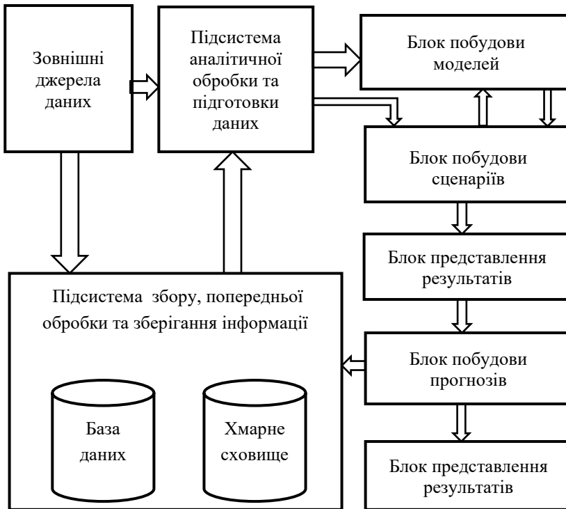
Рисунок 3. Загальна схема застосування інформаційних технологій прогнозування регіонального розвитку

В результаті даного дослідження запропоновано використовувати інформаційні технології для систем підтримки прийняття рішень в управлінні регіональним розвитком в рамках єдиного інформаційного середовища, створеного на єдиній програмно-апаратній платформі, побудованій мережецентричною архітектурою. Вказані інформаційні технології охоплюють всі етапи підтримки прийняття рішень: від збору та оброблення даних до проекту прийняття рішення як на рівні громади, так і регіону. Загальна схема застосування інформаційних технологій для підтримки прийняття рішень в управлінні регіональним розвитком представлена на рис. 3.