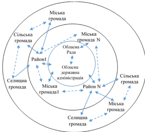
Рисунок 1. Схема мережецентричного управління регіону