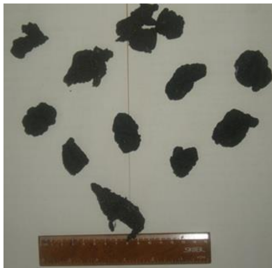
Рис. 3. Брикети з коксового пилу з добавкою пластику, отримані методом холодного брикетування (фото)

На фотографії показані брикети, отримані методом холодного брикетування (рис. 3).