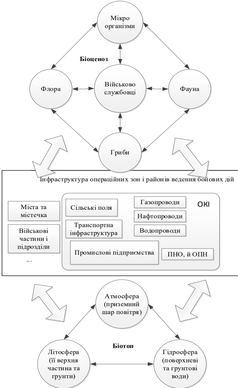
Рис. 2. Принципова схема формування взаємодії між складовими компонентами військової природно-техногенної геосистеми

Застосування озброєння та військової техніки (ОВТ) під час ведення бойових дій спричиняє негативний вплив на військову природно-техногенну геосистему (ВПТГС) в зоні збройного конфлікту, що складається з компонентів біотопу, біоценозу та існуючої інженерної інфраструктури (рис. 2).