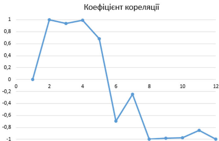
Рис. 4 – Кореляційна залежність температури повітря і захворюваності на Covid-19

Аналіз пари «вологість повітря – захворюваність на Covid-19» проведено аналогічно. Вологість повітря складає 0,85 одиниць на початку року в січні, зменшується до 0,65 влітку та знову починає зростати восени.