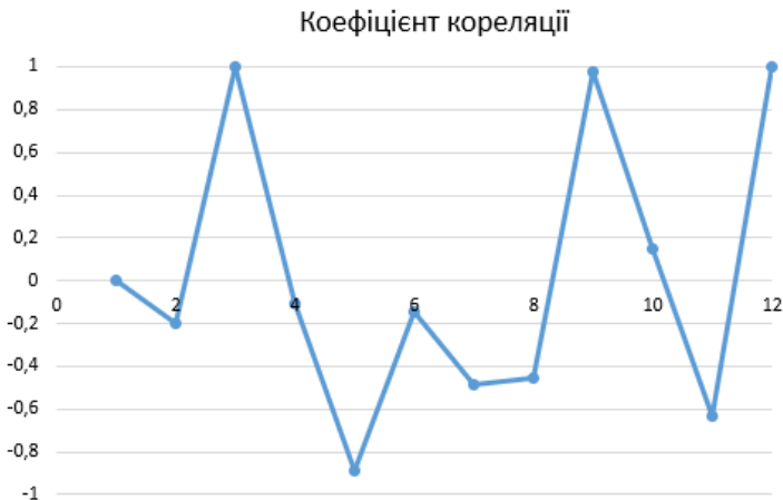
Рис. 8 – Зв'язок між швидкістю вітру і захворюваністю на Covid-19

Аналіз пари «швидкість вітру – захворюваність на Covid-19» проведено за аналогічною методикою. Середня швидкість вітру в Миколаєві за 2020 рік мала місце у межах норми з аномально вітряним квітнем. За квітень у місті пройшло декілька сильних вітрів, під час яких оголошували штормові попередження та які завдавали великих матеріальних збитків. Загальні показники наведено на рис. 8.