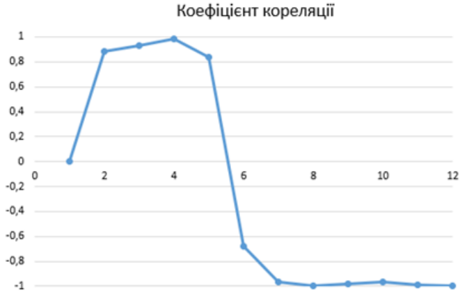
Рис. 7 – Кореляційна залежність сонячної радіації і захворюваності на Covid-19

Кількість хворих значно зросла після вересня, що співпадає з сезонним падінням сонячної радіації. До кінця року кількість сонячної радіації продовжила знижуватися, а кількість хворих – рости. Однозначного причинно-наслідкового зв'язку встановити, опираючись на цю інформацію, неможливо, але відокремлено від інших чинників, можна стверджувати, що зростання захворюваності на Covid-19 пов'язано з рівнем сонячної радіації.