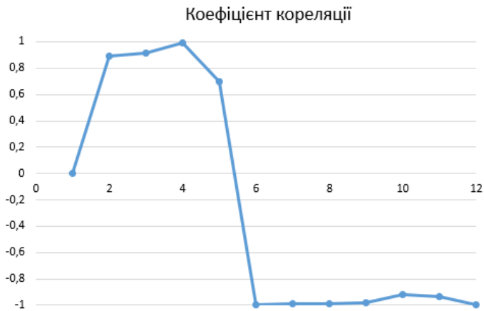
Рис. 6 – Кореляційна залежність тривалості світлового дня і захворюваності на Covid-19

Проведено аналіз для пари «тривалість світлового дня – захворюваність». Визначено, що тривалість світлового дня, рівень сонячної радіації, середня температура і захворюваність є прямо пов’язаними величинами. Про це свідчить загальний графік на рис. 6, на якому показано зв’язок між тривалістю світлового дня і рівнем захворюваності на Covid-19. Коефіцієнт кореляції сягає -1 в другій половині року, що свідчить про сильний зворотний зв’язок величин.