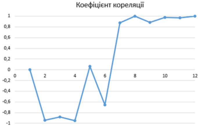
Рис. 5 – Зв’язок між вологістю повітря і захворюваністю на Covid-19

Проведено аналіз для пари «тривалість світлового дня – захворюваність». Визначено, що тривалість світлового дня, рівень сонячної радіації, середня температура і захворюваність є прямо пов’язаними величинами. Про це свідчить загальний графік на рис. 6, на якому показано зв’язок між тривалістю світлового дня і рівнем захворюваності на Covid-19. Коефіцієнт кореляції сягає -1 в другій половині року, що свідчить про сильний зворотний зв’язок величин.