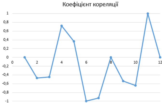
Рис. 9 – Кореляційна залежність кількості опадів і захворюваності на Covid-19

Визначено залежність між показниками кількості опадів і захворюваністю на Covid-19. Так, 2020 рік видався для Миколаєва доволі посушливим, близько 60 мм з піками в червні (120 мм) і вересні (100 мм). Так, зв'язку не спостерігається, що підтверджено кореляційним аналізом, результати якого наведено на рис. 9.