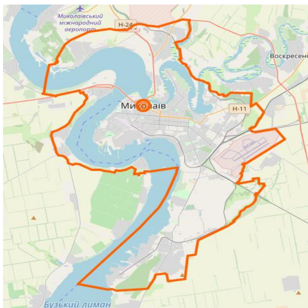
Рис. 2 – Карта міста Миколаєва [12]

У процесі дослідження проаналізовано залежність між парами вибірок даних (температура повітря – захворюваність; вологість повітря – захворюваність та ін.) Кожний з кліматичних чинників порівнювався з приростом хворих на коронавірус у розглянутому діапазоні часу [13].