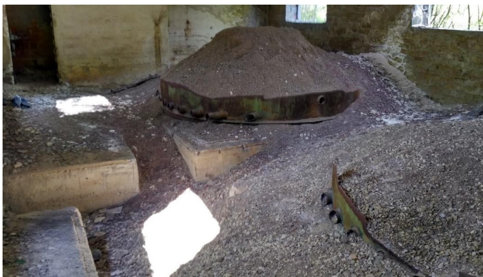
Рис. 2 – Загальний вигляд піщано-гравійних фільтрів

За результатами проведених досліджень існуючих споруд очищення зливових вод та можливості їх реконструкції пропонується.