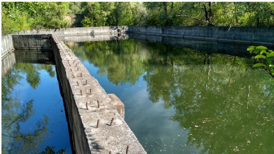
Рис. 1 – Загальний вигляд накопичувача № 1

На сьогодні очисні споруди не придатні до експлуатації (загальний вигляд наведено на рис. 1 та 2). Весь комплекс очисних споруд потребує реконструкції з проведенням проектних робіт для впровадження новітніх технологій відділення від води нафтопродуктів та доочищення поверхневих стічних вод, а також організації роботи в самопливному режимі.