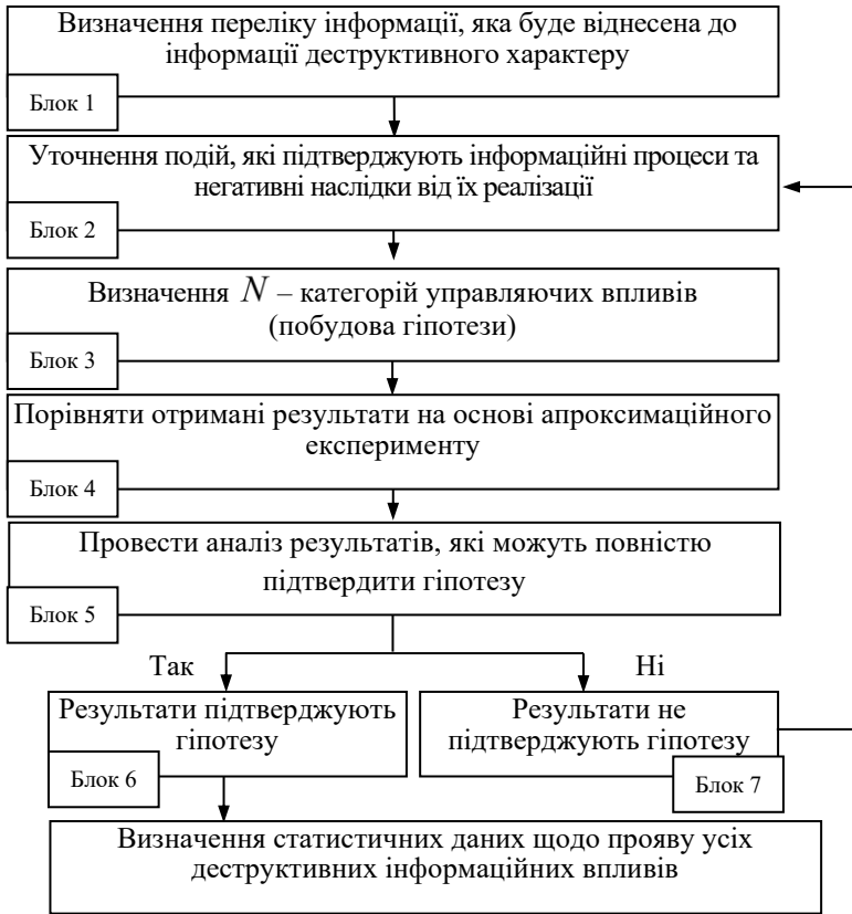
Рис. 3. Блок-схема удосконаленого методу семіотичного аналізу для виявлення інформаційно-психологічного впливу

Наведений підхід має ряд переваг, пов'язаних із тим, що цільові аудиторії вірять в дезінформацію і самі можуть її поширювати, не здогадуючись про це. В такому випадку цільова аудиторія буде одночасно знаходитись під деструктивним інформаційним впливом та транслувати цей вплив на інші соціальні групи.