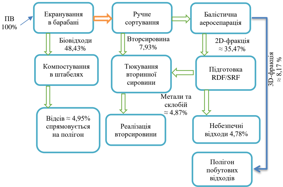
Рис. 3. Розподілення балансу відходів на установці механіко-біологічного оброблення

Спрощена технологічна схема механіко-біологічного оброблення відходів з компостуванням та отриманням RDF/SRF показана на рис. 3. На схемі застосовано розподіл матеріального балансу за основними технологічними напрямками, який сформовано на основі результатів таблиці 2. Вся маса змішаних відходів поступає конвеєром в циліндричний барабанний грохот для екранування. За рахунок вільного просування відходів вздовж по циліндру та його обертів маса відходів розділяється на дві фракції – до 80 мм та більше 80 мм. При подальшому компостуванні також відбувається сепарація готового технічного компосту, при якій відокремлюється інертний відсів та спрямовується на полігон побутових відходів.